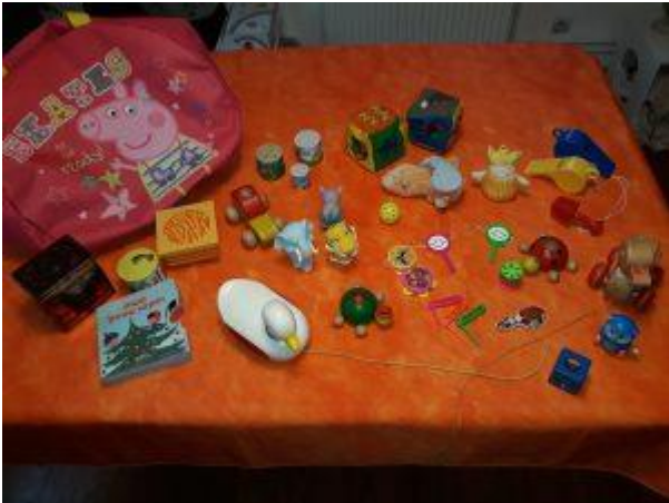
La collection des jouets