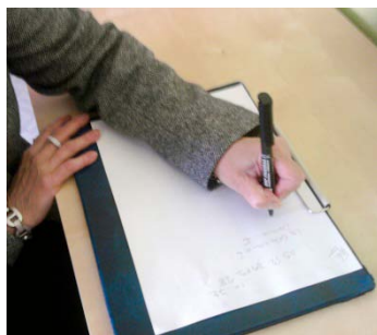
Adulte gauchère qui incline la feuille dans l'axe du bras