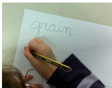
Élève droitier qui cache ce qu'il écrit et gagnerait à placer sa main sous la ligne d'écriture

Il convient surtout d'éviter de laisser les autres enfants énoncer des propos discriminants au sujet des gauchers, c'est une différence ordinaire, au même titre que la couleur des yeux ou des cheveux. Les gauchers ne sont pas plus maladroits que les droitiers, malgré certaines représentations. Il semble même que ce soit un avantage pour certains sports.