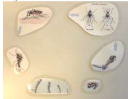
Images à remettre dans l'ordre

Bilan : Un mâle et une femelle adulte s'accouplent en plein vol. Le mâle se nourrit de sucs végétaux tandis que la femelle se nourrit de sang. La femelle pond ses œufs sur l'eau. Les œufs éclosent et donnent naissance à des larves. Elles grandissent dans l'eau et se transforment en nymphes qui se métamorphosent en adultes au bout de 3 jours. Le moustique adulte émerge et va vivre dans le milieu aérien.