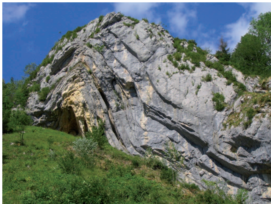
Plissement anticlinal des terrains du jurassique.

Quand la contrainte est relâchée, le matériau reste déformé. Exemple : les plis.