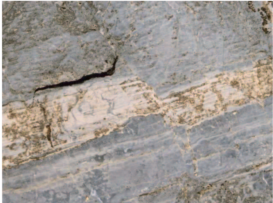
Faille d'extension dans des strates alternées de calcaire et de dolomie du Trias.

Elles sont irréversibles car il y a rupture. Exemple : les failles.