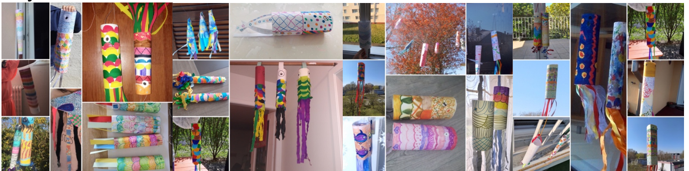
Les maîtresses de l'école Lix élem