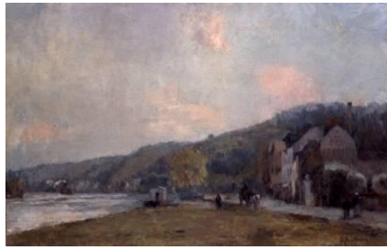
Albert Lebourg (1849 – 1928) La Seine à Croisset [salle 20]