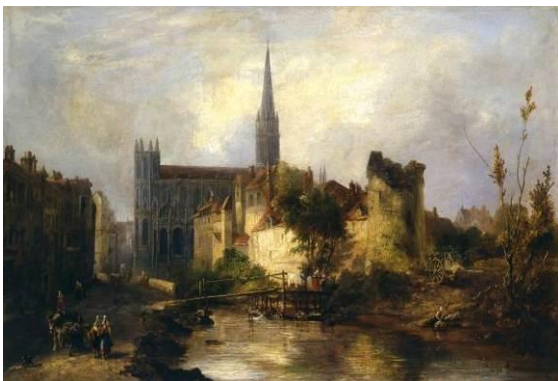
William FOWLER (actif à Londres entre 1825 et 1865)

> Comprendre : la mer dans la mythologie, peinture du XVIII e siècle, rococo, esquisse, peinture décorative.