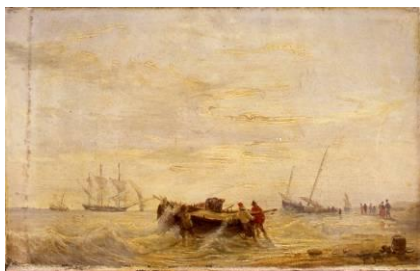
Théodore Gudin (1802 – 1880) Marine [salle 20]