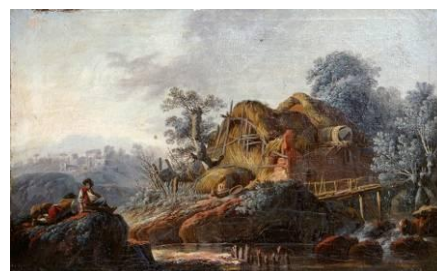
Jean Pillement (1728 – 1808) Chaumière près d'une rivière , fin XVIII e [salle 16]