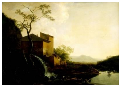
Jean Asselijn (vers 1615 – 1652) Paysage au moulin à eau [salle 8]