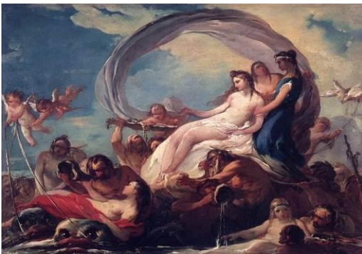
Joseph-Marie VIEN (1716-1809),

> Comprendre : scène de l'Ancien Testament (autres passages de la vie de Moïse liés à l'eau : le passage de la mer Rouge, Moïse faisant jaillir l'eau du rocher...), l'eau dans les récits religieux (eau salvatrice, porteuse de message), symbolique du Nil, représentation théâtralisée et dans le goût de l'époque, peinture religieuse.