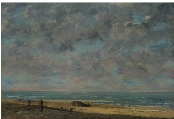
Gustave COURBET (1819-1877)

> Comprendre : paysage maritime appelé « marine », esquisse, geste, matière, énergie, rapidité, inspiration de la réalité, romantisme, contraste, dramatisation par la couleur.