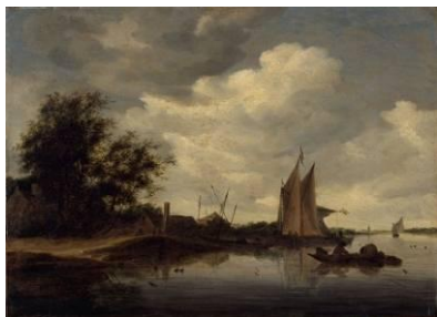
Salomon Van Ruysdaël (Apr.1600 – 1670) Paysage maritime , 1661 [salle 8]