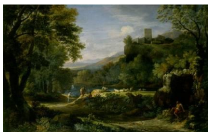
Gaspard Dughet (1615-1675) Paysage du Latium , vers 1660 [salle 11]