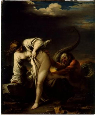
Salvator ROSA (1615 – 1673)