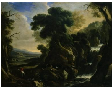
Anonyme flamand ou français Paysage animé avec une cascade , Deuxième moitié du XVII e [salle 11]