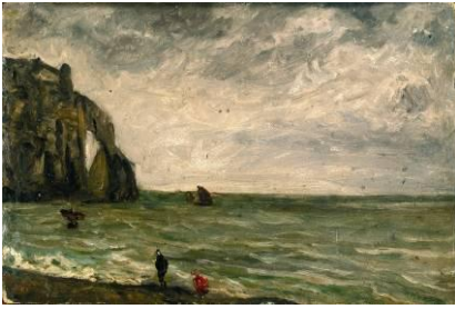
Paul Huet (1803 – 1869) Étretat, la porte vue de la plage , 1868 [salle 20]