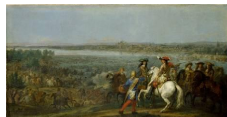
Adams Frans Van Der Meulen (1632 – 1690) Le Passage du Rhin [salle 12]