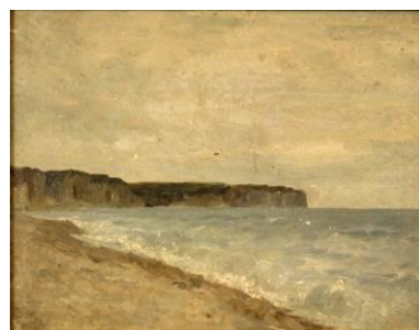
Adolphe Félix Cals (1810 – 1880) Normandie, bord de mer [salle 20]