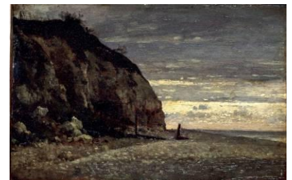
Adolphe Félix Cals (1810 – 1880) Falaise de Villerville [salle 20]