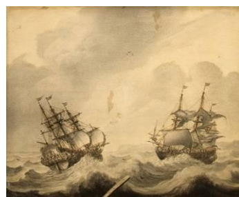
Cornelisz Pieterz de Mooy (Av.1656 – 1693) Marine , 1691 [salle 8]