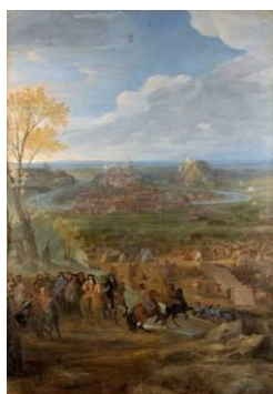
Jean-Baptiste Martin (1659 – 1735) Le Siège de Besançon , vers 1685 [salle 14]