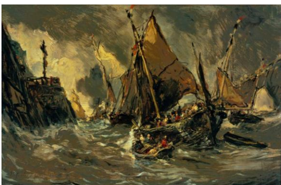
Eugène ISABEY (1803-1886)

> Comprendre : Lépine joint le pré-impressionnisme hérité de Corot et Daubigny et l'impressionnisme : rénovation du paysage moderne par notation sensitive de la lumière et des atmosphères, utilisation de tonalités grises et des touches dissociées.