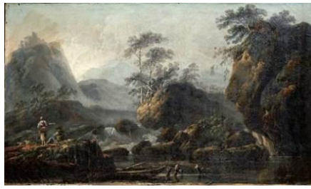
Jean Pillement (1728 – 1808) Paysage à la cascade, fin XVIII e [salle 16]