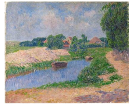
Henri Moret (1856 – 1913) Paysage [salle 20]