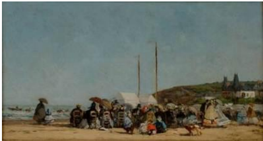
Eugène Boudin (1824 – 1898) La Plage de Trouville , 1864 [salle 20]