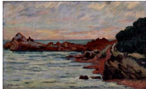
Armand Guillaumin (1841 – 1927) Le Cap Long à Agay , 1893 [salle 20]