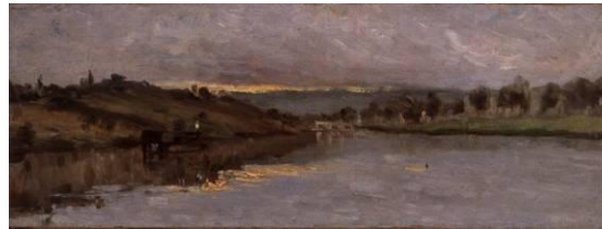
Stanilas Lépine (1835 – 1892), La Seine à Charenton [salle 18]