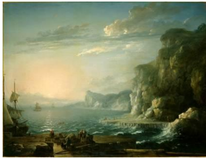
Antoine Lebel (1705 – 1793) Le Soleil couchant, 1746 [salle 16]