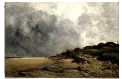
Antoine Guillemet (1843 – 1918) Plage de Villerville, 1876 [salle 20]