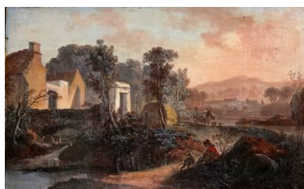
Jean Pillement (1728 – 1808) Paysage : Le Pont de la rivière , fin XVIII e [salle 16]