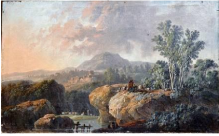
Jean Pillement (1728 – 1808) Paysage au berger, fin XVIII e [salle 16]