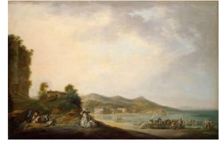
Paret y Alcazar Luis (1746-1799) Vue de Fontarabie [salle 16]