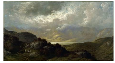
Gustave Doré (1832 – 1883) Paysage d'Écosse, 1881 [salle 18]