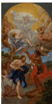
il Baciccio Le Baptême du Christ [salle 10]