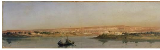
Jean-Charles Langlois (1789 – 1870) L'île de Gézireh, le port de Boulaq et la ville du Caire vus depuis la rive ouest du Nil [salle 17]