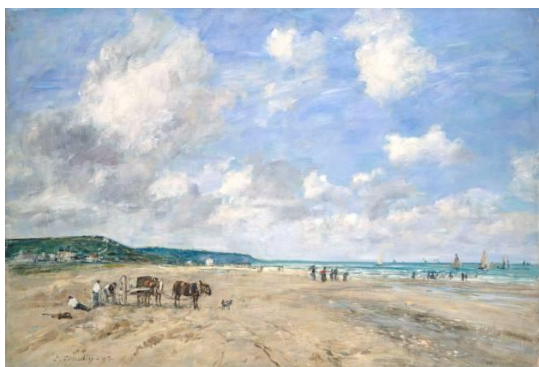
Eugène BOUDIN (1824-1898)

> Comprendre : l'art paysager de Courbet, chef de file du réalisme, peinture réalisée en atelier d'après souvenirs.