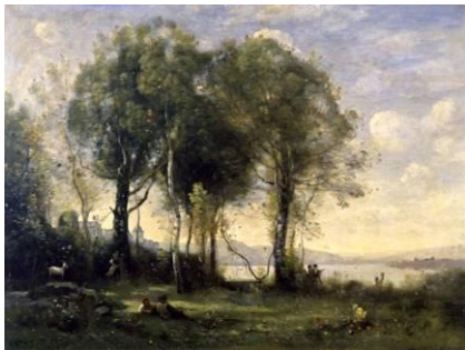
Jean-Baptiste Camille Corot (1796 – 1875) Les Chevaliers de Castel Gandolfo, 1865 – 1870 [salle 18]