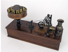
Le praxinoscope :