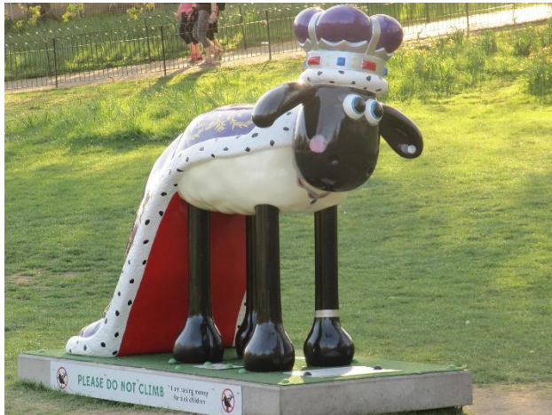
Happy and glorious version « british Queen »

Les Britanniques sont très souvent sollicités pour faire des dons à des œuvres de charité et ils donnent bien volontiers. Un appel aux dons Shaun in the city a été organisé au printemps 2015 par Wallace and Gromit's Children's foundation et les studios Aardman Animations. Cette œuvre de charité a proposé 120 sculptures grand format en fibre de verre de Shaun le mouton, réalisées par des artistes et des célébrités. Ces sculptures ont été exposées dans les endroits touristiques et des parcs de Londres et de Bristol. Les 50 premières sculptures ont été exposées à Londres du 28 mars au 31 mai 2015 et 70 autres sculptures ont été dévoilées à Bristol du 6 juillet au 31 août 2015.