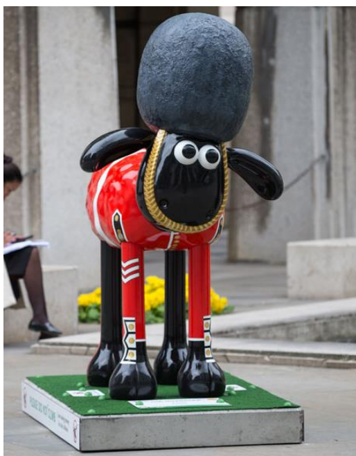
The guardian version garde de la reine