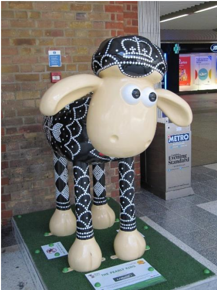
The Pearly King