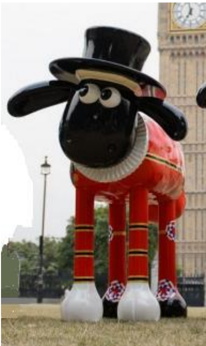
Yeoman of the baaaard version garde de la tour de Londres.