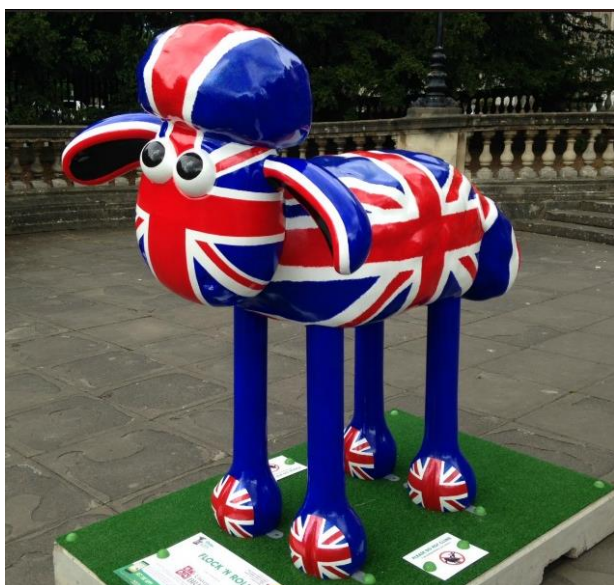
Flock 'n' roll version « union flag »