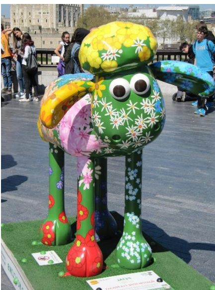
Petal version jardin anglais