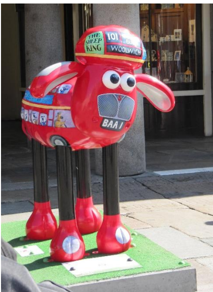
Another one rides the bus , version « double-decker bus »