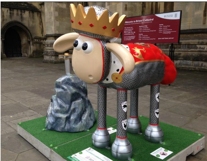
King Arthur of Lambelot & Excalibaaar