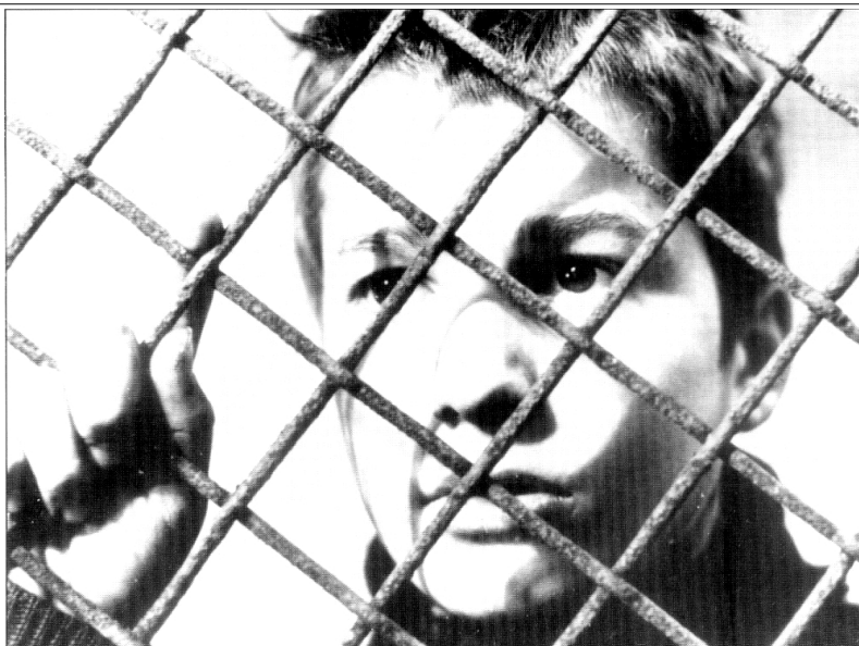
Jean-Pierre Léaud (Antoine Doinel)