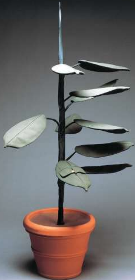
Ficus elastica decora I 160 x 90 x 90 cm