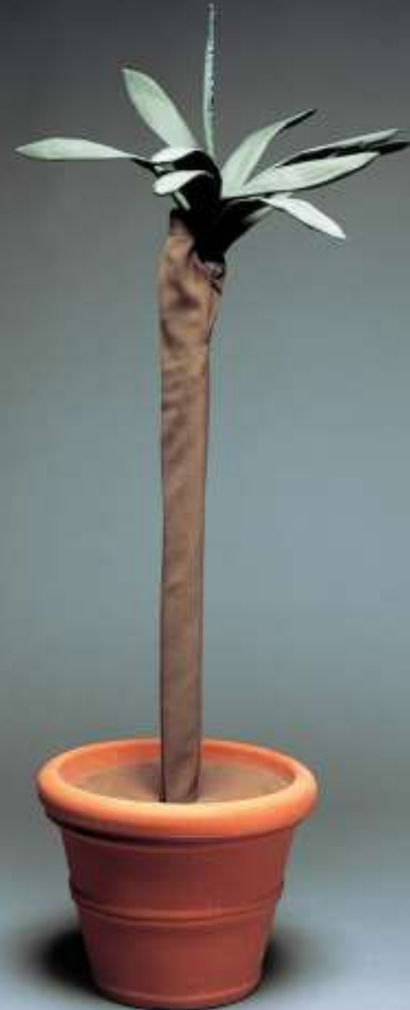
Yucca hauteur: 130 cm diamètre: 50 cm