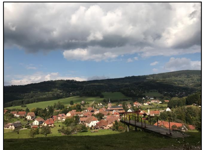
Ranrupt (67420) en 1901 et en 2018.