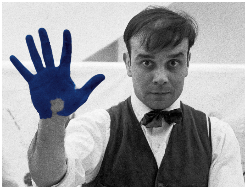
Portrait d'Yves KLEIN

Une citation de Van Gogh , parlant de ses autoportraits : « Je ne cherche pas à faire cela par la ressemblance photographique mais par nos expressions passionnées, employant comme moyen d'expression et d'exaltation du caractère, notre science et goût moderne de la couleur ».