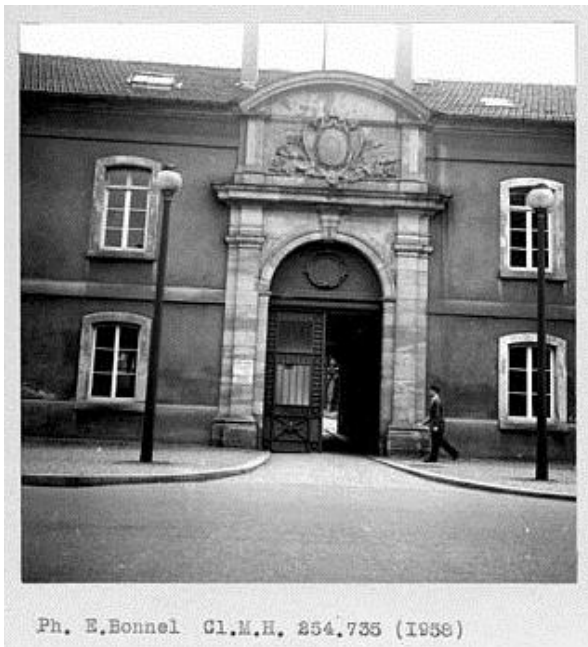
Cl.M.H. 254.735 (1958)

Le portail d'entrée est à pilastres. Il est orné d'un grand cartouche à médaillon aveugle sur le fond de trophée d'armes usuel dans l'iconographie militaire classique.