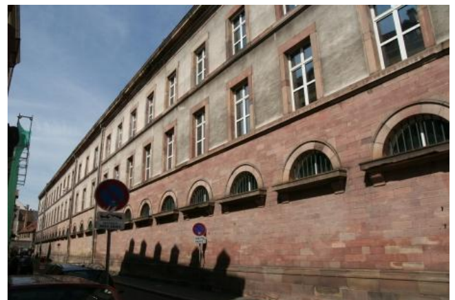
L'enfilade de la façade sur rue Calvin