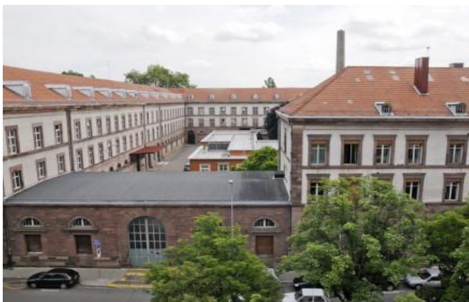
Vue de la rue de la Krutenau