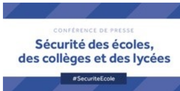
Sécurité des écoles, collèges et lycées