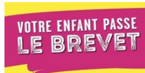
Participez au quiz pour tester vos connaissances sur le diplôme national du brevet