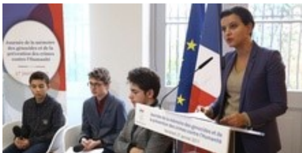
Journée de la mémoire des génocides et de la prévention des crimes contre l'Humanité 2017